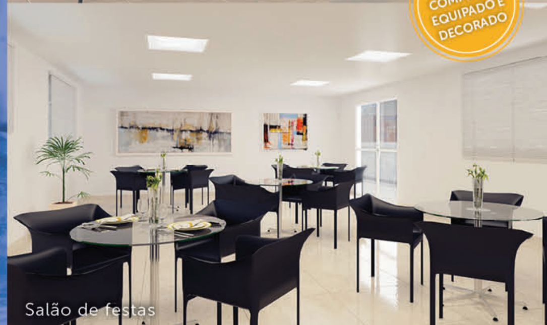
Salão de festas