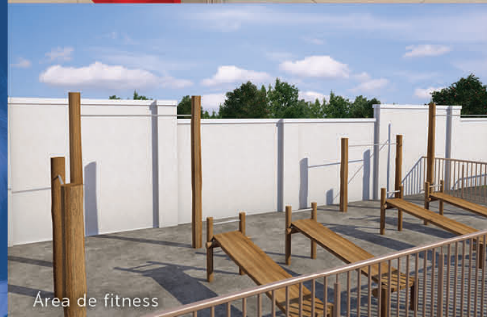
Área de fitness