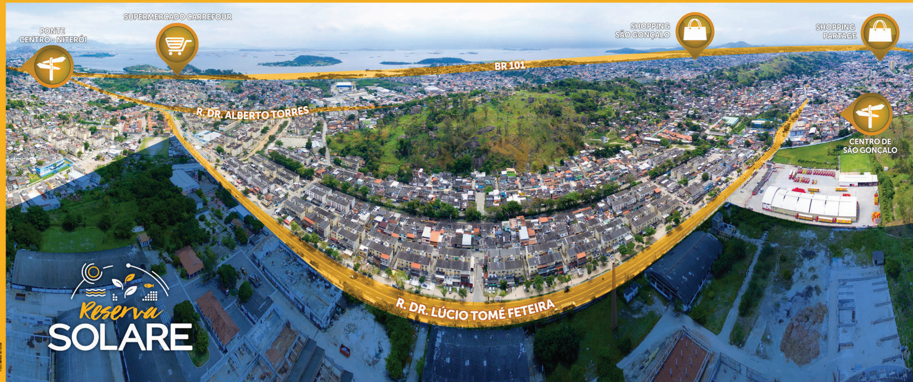
Foto aérea do local