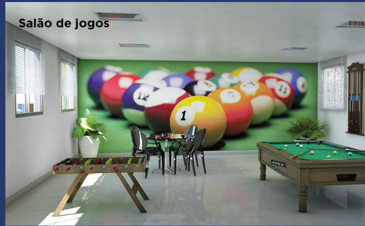
Salão de jogos

Perspectivas artísticas. Este material tem caráter meramente ilustrativo por se tratar de item a ser construído. O mobiliário, e os equipamentos não foram parte do contrato de compra e venda. Os materiais e cores representados poderão sofrer pequenas alterações sem prejuízo ao seu comprimento de prazo e sem prejuízo da disponibilidade dos mesmos no mercado.