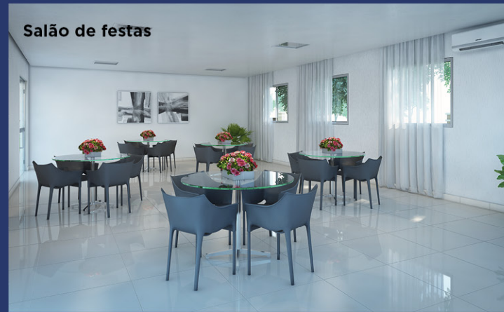
Salão de festas