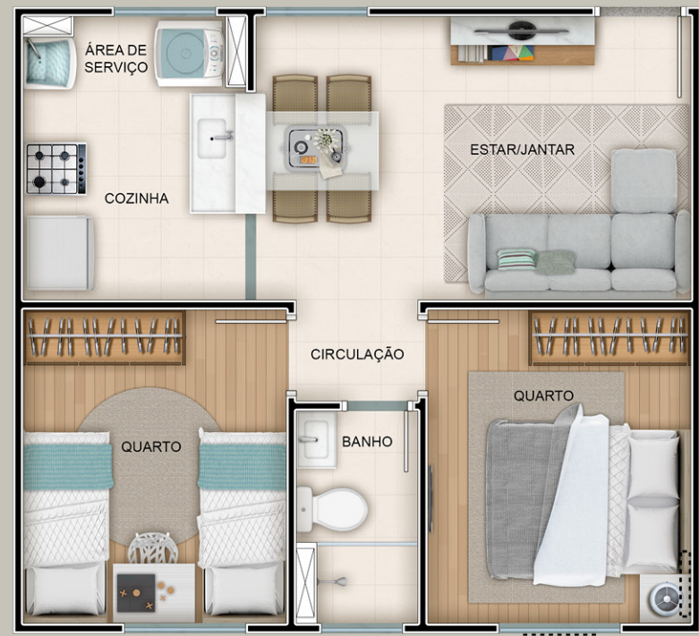
APTO. TIPO 2 QUARTOS

Seu projeto de vida merece um conforto assim.