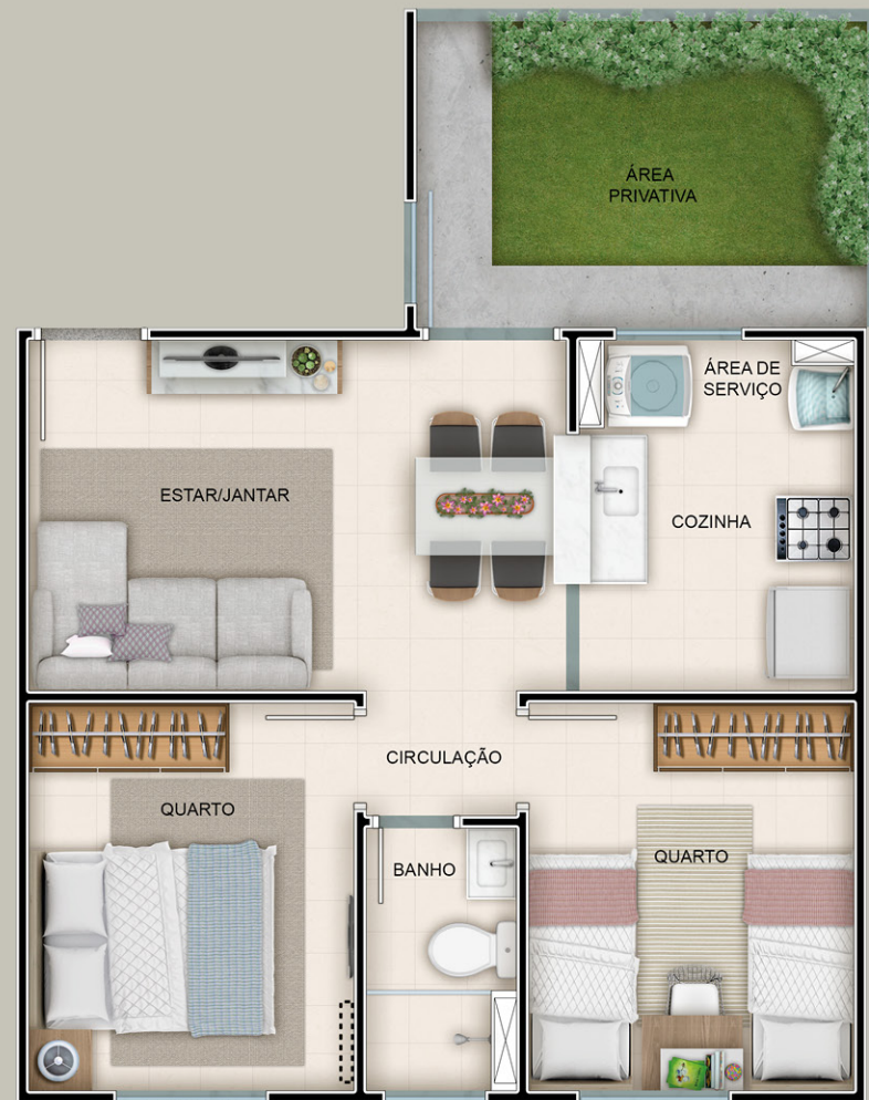
UNIDADE GIARDINO 2 QUARTOS ÁREA PRIVATIVA

Perspectivas artísticas. Este material tem caráter meramente ilustrativo por se tratar de item a ser construído. O mobiliário e os equipamentos não fazem parte do contrato de compra e venda. Os materiais e cores representados poderão sofrer pequenas alterações sem prévio aviso em função da disponibilidade dos mesmos no mercado.